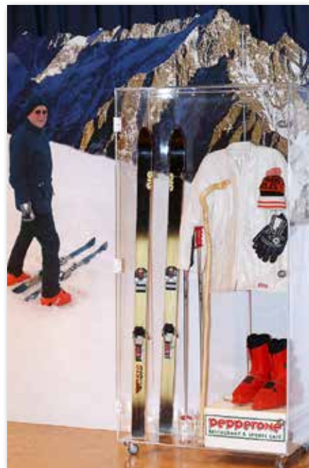
Gli sci e l'attrezzatura sportiva di Santo Papa Wojtyła